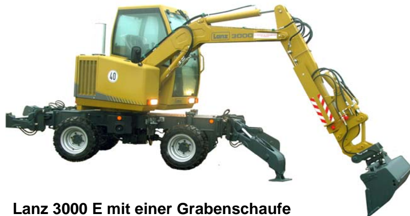
Lanz 3000 E mit einer Grabenschaufe