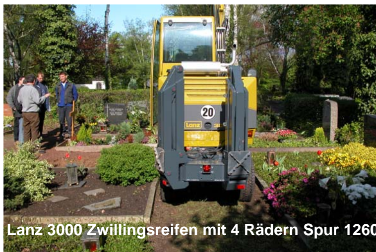
Lanz 3000 Zwillingsreifen mit 4 Rädern Spur 1260